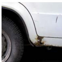
AUTO MOBILE HOME